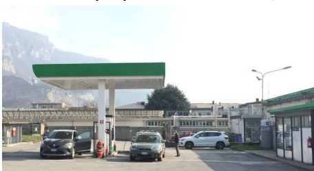
LECCO, Via Fiandra, 9 GPL