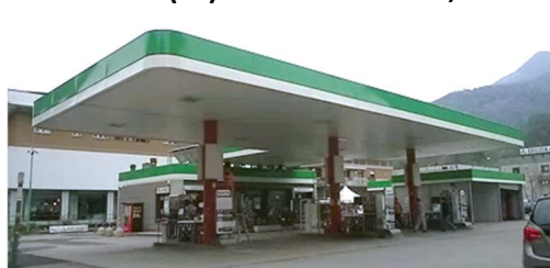
ZOGNO (BG) Via Locatelli, 9 - RT