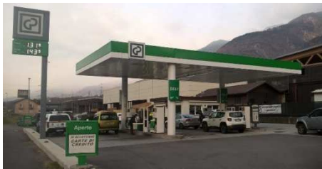
CASTIONE ANDEVENNO (SO) - RT Via Nazionale, 3 (SS38) + AdBlue