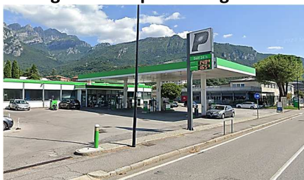
PETROLCARBO LECCO (LC) Via Fiandra, 7