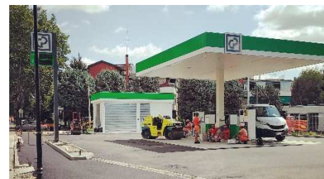
CINISELLO BALSAMO (MI) - RT Via VVX Aprile, 245