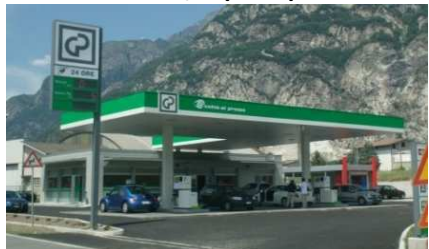
NOVATE MEZZOLA (SO) - SS36 "anche per GPL"