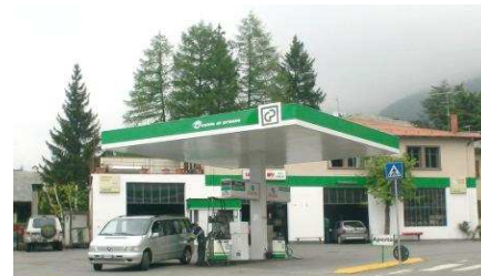
BORMIO SS38 dello Stelvio "negli orari di presenza gestore"