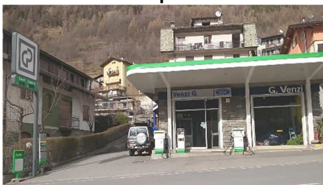
LANZADA (SO) Via Pizzo Scalino, 144