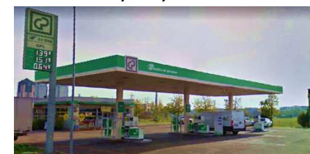
VIMERCATE (MB), Via Villasanta "anche GPL"