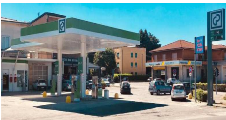
DALMINE (BG) - RT Via Provinciale, 38