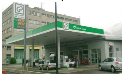
LECCO Via Fiandra, 23, anche AdBlue