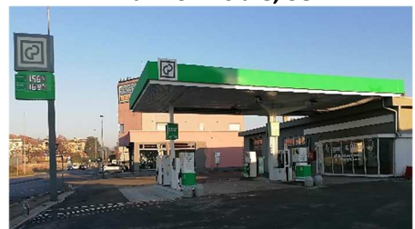
MARIANO COMENSE (CO) - RT Via Isonzo, 111, anche AdBlue