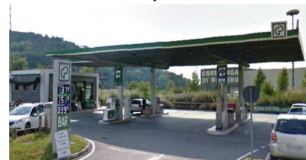
NEMBRO (BG) - RT Via Acqua dei Buoi, 13 anche AdBlue