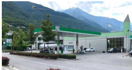
SONDRIO Via Vanoni "anche per GPL"