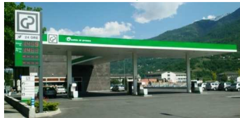
SONDRIO Via Tonale, 12