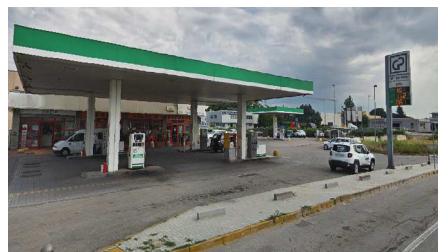
CAMBIAGIO (MI) Via Delle Industrie, 1 "anche GPL"