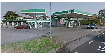
ABBIATEGRASSO (MI) - RT Via Dante, 7