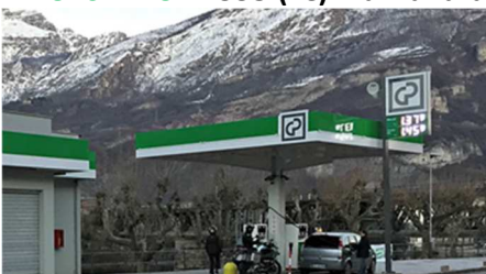
GALBIATE (LC) Via Ettore Monti, 8 - RT