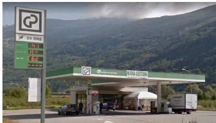
LOVERO (SO) SS38 dello Stelvio - RT "anche per GPL"