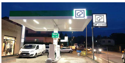
CESANA BRIANZA (LC) Via De Gasperi, 31 - RT